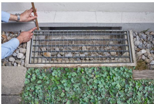
Massaufnahme der Höhe