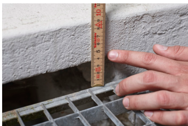
Innenmass zwischen Gitterrost und Wandausschnitt messen und 25mm dazurechnen.