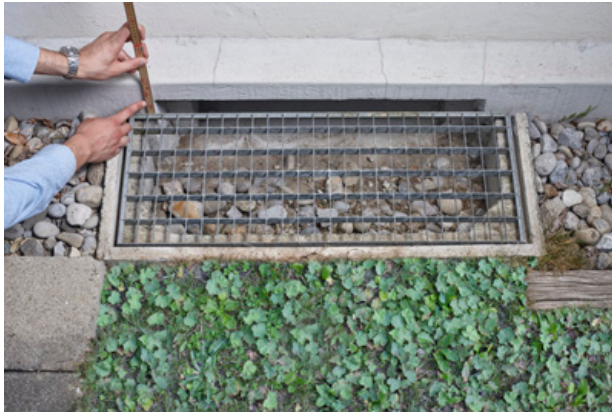
Massaufnahme der Höhe